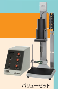
バリュースセット