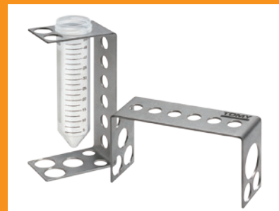
超音波チューブスタンド STS-01