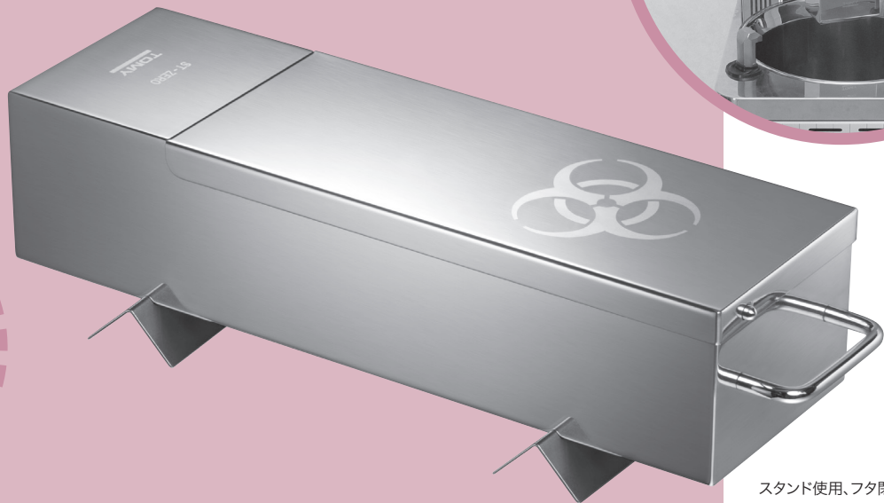
スタンド使用、フタ閉